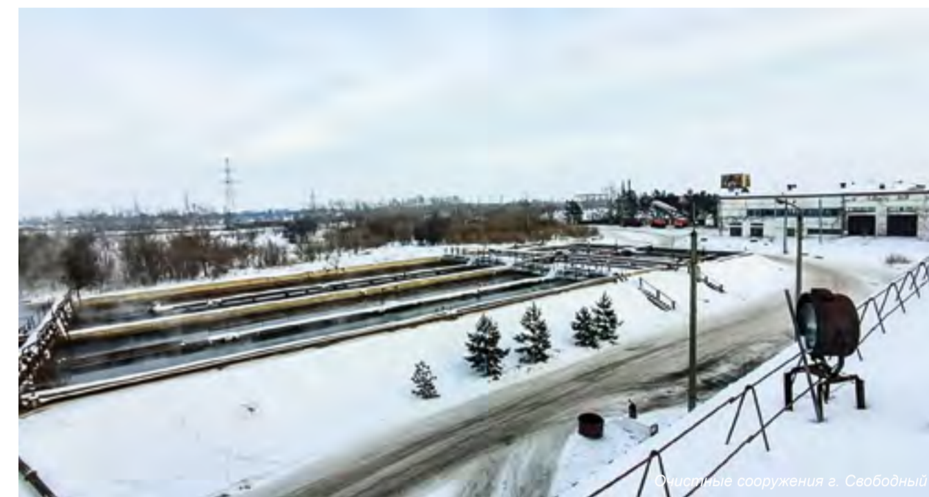
Очистные сооружения г. Свободный

ект сооружается для нужд АО «Дальневосточная распределительная сетевая компания». Заказчиком выступает ПАО «РусГидро». Сдача работ намечена на весну 2020 года. После запуска обновленной подстанции будет покрыт дефицит энергомощности, имеющейся в регионе, а также будут обеспечены электроэнергией новые резиденты ТОР. Серьезным испытанием для специалистов ГЭМ станет строительство очистных сооружений г. Свободный. Договор был заключен в прошлом году, и уже в январе 2020 года гэмовцы приступили к зем-