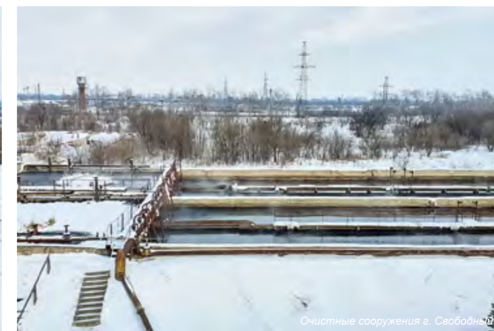
Очистные сооружения г. Свободный