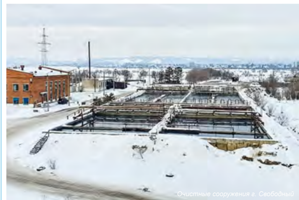
Очистные сооружения г. Свободный