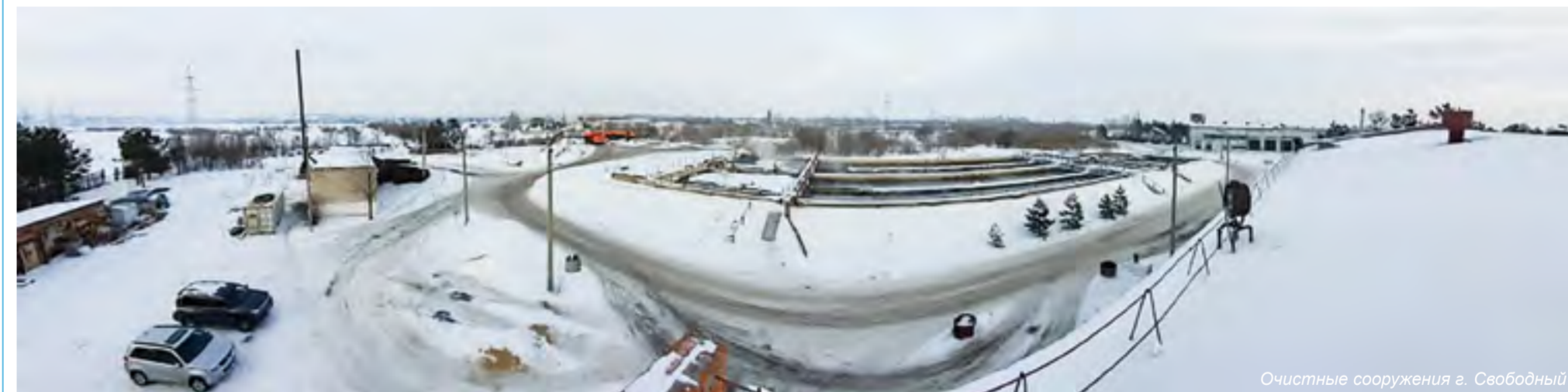
Очистные сооружения г. Свободный

ПС 110 кВ «Маслозавод» находится недалеко от маслоэкстракционного завода «Амурский», на площадке Территории опережающего развития «Белогорск». Объ-