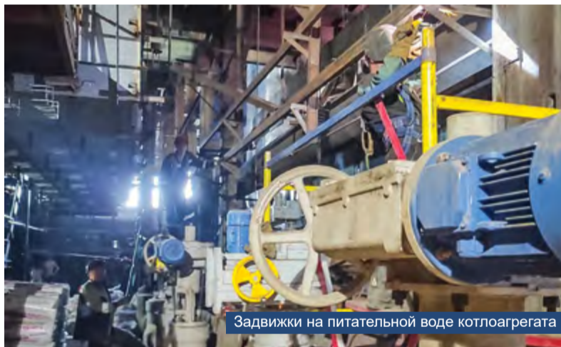
Задвижки на питательной воде котлоагрегата