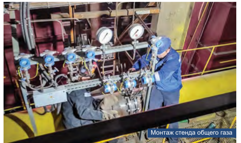
Монтаж стенда общего газа

хорошо знакомая. Это не первый объект теплоэнергетики, на котором работают гэмовцы. За время реализации проекта пришлось