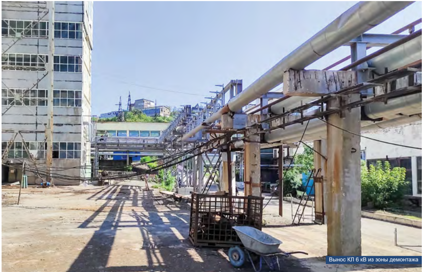
Вынос КЛ 6 кВ из зоны демонтажа

Работа на объекте для специалистов предприятий ГК «ГЭМ»